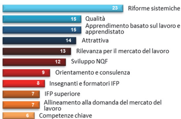
Figura 2. Principali ambiti di riforma delle politiche in materia di IFP nel quadriennio 2010-14 (numero di paesi)

Alla domanda riguardante i principali cambiamenti strategici intervenuti a livello di politica nazionale in materia di IFP dal 2010, 23 paesi sottolineano i miglioramenti sistemici e in particolare le modifiche normative o di politica necessarie per adattare o introdurre nuovi programmi, iter e qualifiche (Figura 2). Tra le questioni che interessano i diversi paesi, particolare attenzione viene dedicata al miglioramento della qualità e dell'attrattiva dell'IFP. I paesi hanno definito priorità, e taluni utilizzano il comunicato di Bruges come un menù dal quale selezionare le tematiche di maggiore interesse nazionale.