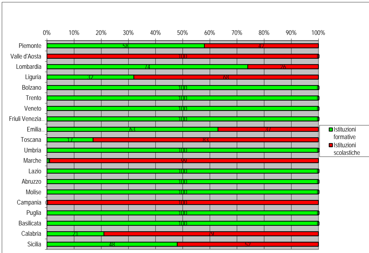
Grafico 2 - Tasso di scolarizzazione e formazione nella IeFP al primo anno (stima per l'a.f. 2010/11)