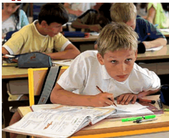
2020: cosa ci sarà di vecchio

E' ormai invalsa l'abitudine, ad ogni inizio di anno, di fare una previsione delle nuove tendenze nel mondo della scuola e contestualmente una sorta di inventario di ciò che è destinato a scomparire. In realtà chi vive all'interno della scuola non ha ancora, nel nostro Paese, così chiara la percezione di ciò che scomparirà, mentre è molto chiara la "persistenza" dell'organizzazione tradizionale. Ciò che ognuno di noi percepisce dall'interno è invece la crescente insofferenza degli studenti verso questa scuola, che è divenuta sempre più difficile da gestire.