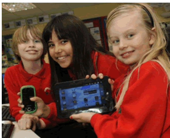
2012: cosa c'è di nuovo